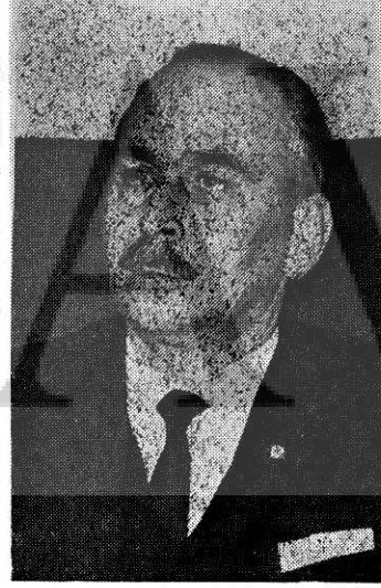
«Sosyalizmin güler yüzleri.,»

Aybar, daha sonra sözü anti-emperyalist mücadeleye getirerek şöyle konuştu: